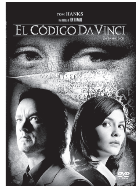
Cartel de la película El Código Da Vinci, basada en el libro de Dan Brown.

mente. El tiempo que transcurra tras la sentencia condenatoria puede servir para que aparezcan nuevas evidencias, para que cambien los preceptos legales y sean menos duros, más humanos, para que tal vez una confesión inesperada o una investigación más profunda aclare los hechos.