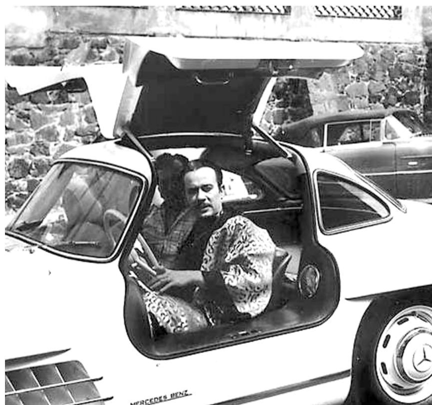
Curiosa foto de Pedro en un Mercedes Benz 1956, conocido como "Alas de Gaviota", en un descanso de la filmación de "Escuela de Rateros".

La Vida No Vale Nada, producida en 1954, fue la única que mereció de la cinematografía mexicana el premio Ariel, para Pedro Infante. Junto a él, llevaron