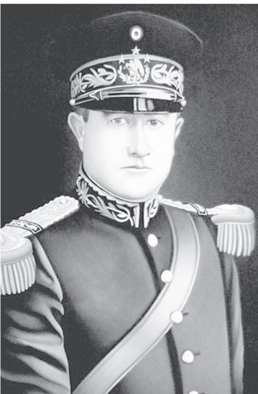
PINTURA AL ÓLEO POCO CONOCIDA DE Maximino Ávila Camacho.