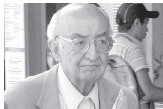
AGUSTÍN ACOSTA LAGUNES, QUIEN falleció el 12 de abril de 2011, era el gobernador de Veracruz cuando Roque Spinozo Foglia fue asesinado.