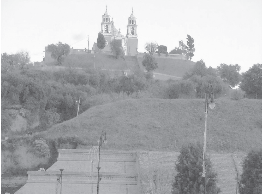
Otra vista de la Iglesia del Cerrito, sobre las ruinas arqueológicas.