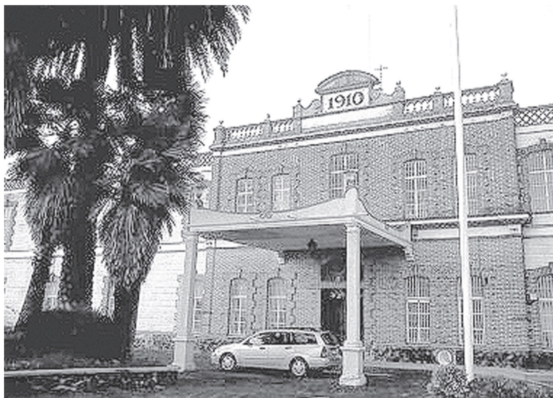
En lo alto del manicomio domina un letrero: 1910. Tal fue el año en que se terminó de construir.