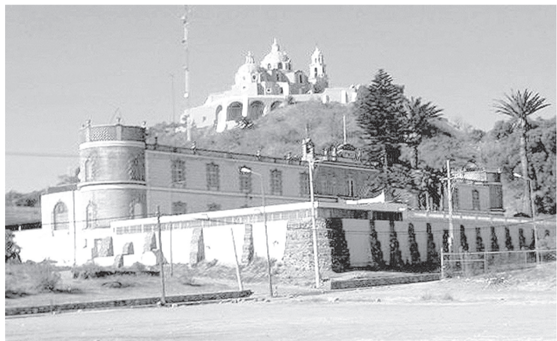
Sobre el manicomio, domina el panorama la Iglesia de Nuestra Señora de los Remedios, conocida también como Iglesia del Cerrito.