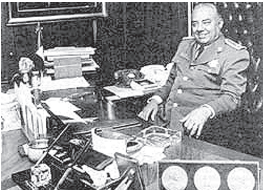
ARTURO DURAZO, EL EX JEFE POLICIACO Y amigo de López Portillo.