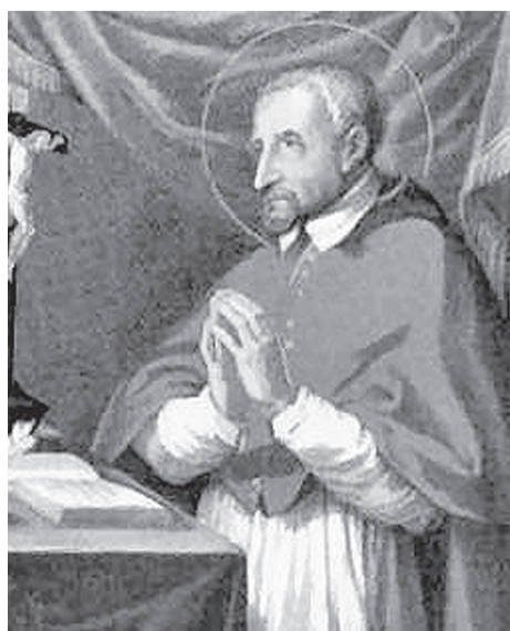
San Roberto Belarmino