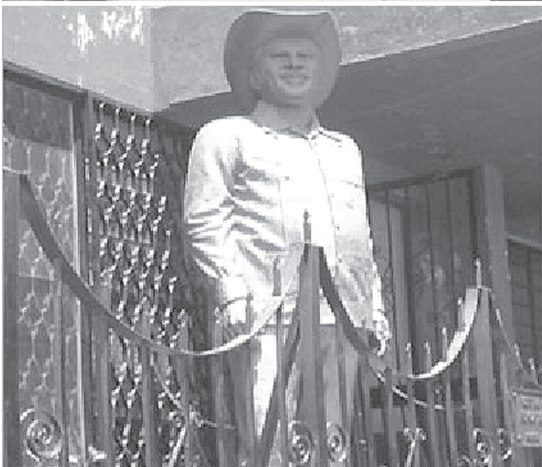
EFIGIE-MONUMENTO POCO CONOCIDO de Roque, en un casino cañero.