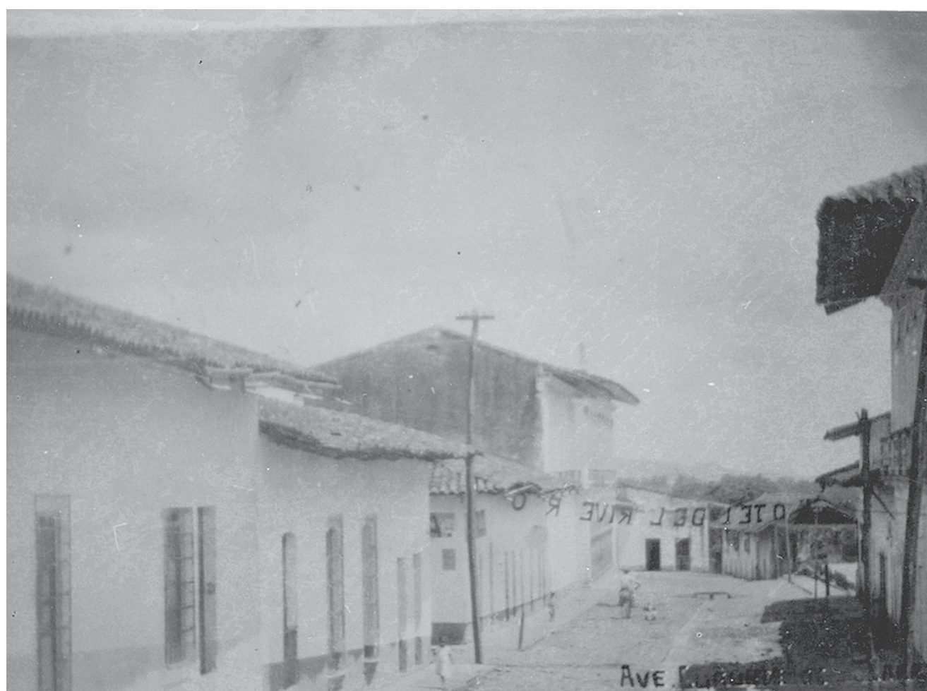
Esta calle era Cuauhtémoc, hace 87 años, en 1930. Al fondo se alcanza a ver el parque central, del lado derecho. La esquina que se ve del lado izquierdo es Ferrer, donde estaba el Hotel Del Rivero y una manita que cruza de lado a lado de la calle Cuauhtémoc así lo deja ver. La entrada a la población era entonces por Gutiérrez Zamora.

Pasaron los meses y ella no podía hablarle de tú. Lo platicaron muchas veces, pero ella no entendía por qué no se podía dirigir a él de esa manera,