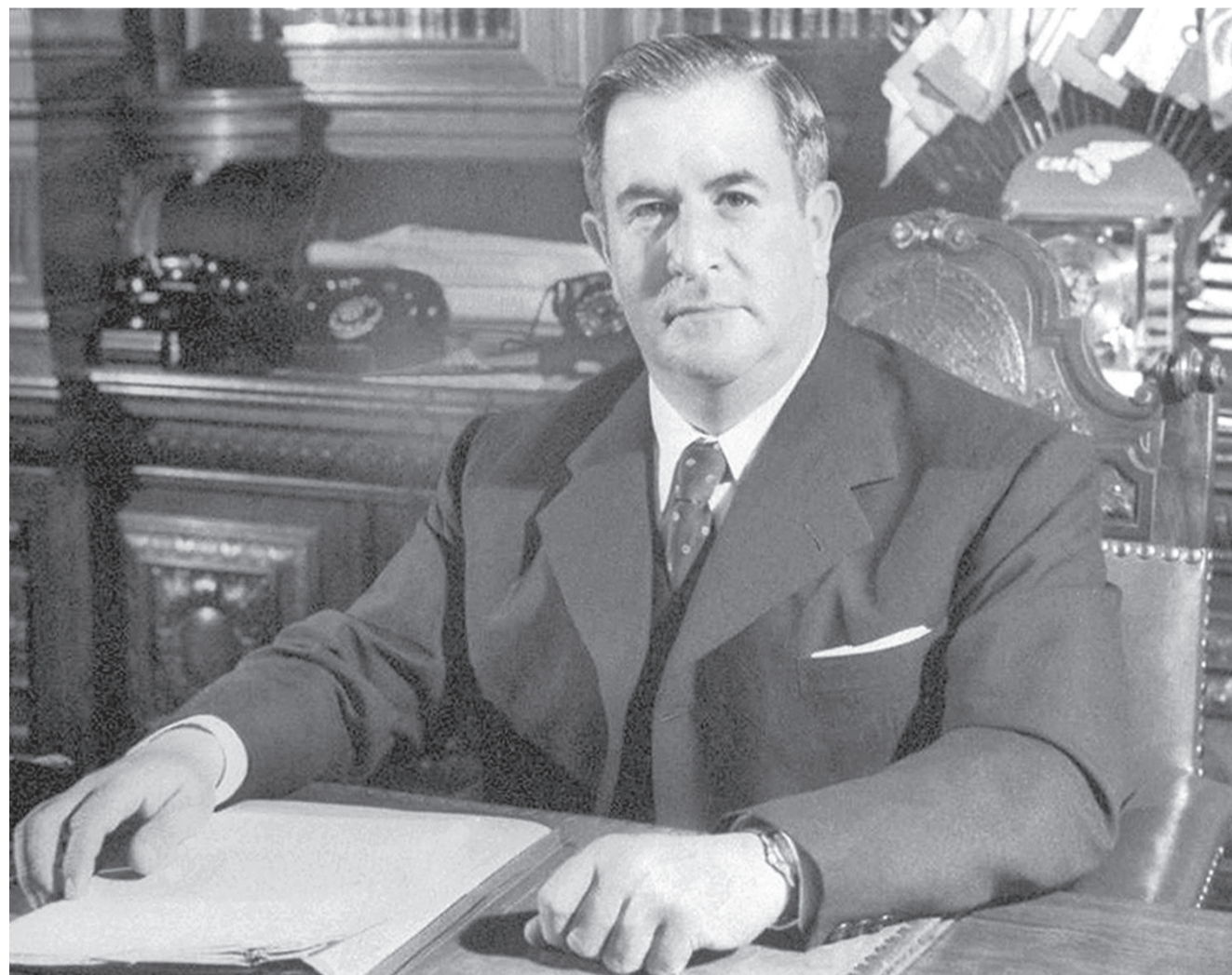
Manuel Ávila Camacho, presidente de México.

Si el infarto me hubiera dado en Tlapacoyan, habría yo fallecido, porque no tenemos un hospital con Unidad de Coronarias. Médica Sur tenía, cuando me dio el infarto, la mejor unidad. Si hubiera yo llegado al hospital diez minutos después de la hora en que me