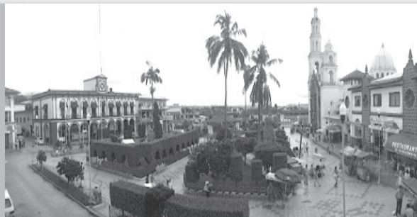
Gráfico DE MARTÍNEZ DE LA TORRE CRÓNICAS de Tlapacoyan