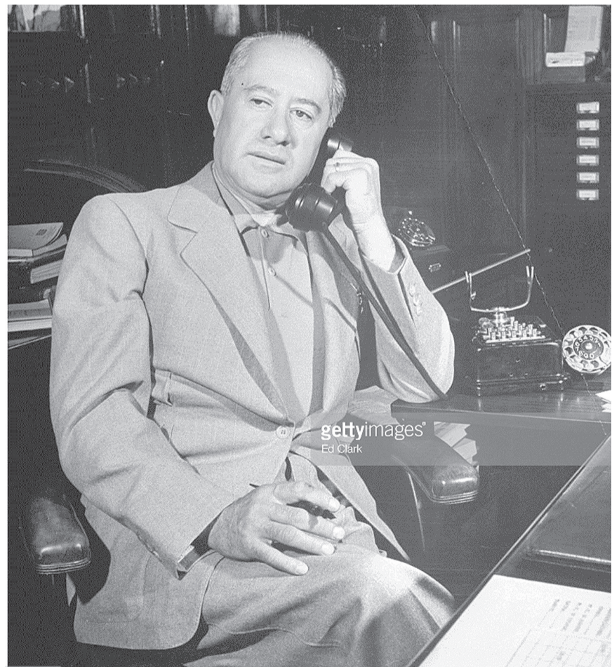
Maximino Ávila Camacho.

en salir porque no me podían sacar de una arritmia que surgió tras el infarto.