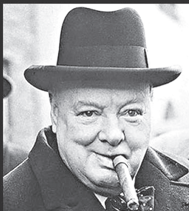
Winston Churchill (1874-1965) Político británico.

"El político se convierte en estadista cuando comienza a pensar en las próximas generaciones y no en las próximas elecciones".