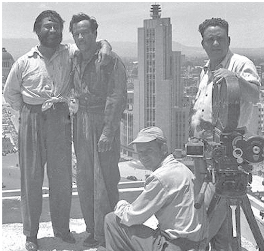
Una foto poco conocida de Pedro Infante, tomada en la azotea donde pelea contra El Tuerto, el villano de la película Nosotros los Pobres. Este año, el 18 de noviembre, habría cumplido cien años de edad.