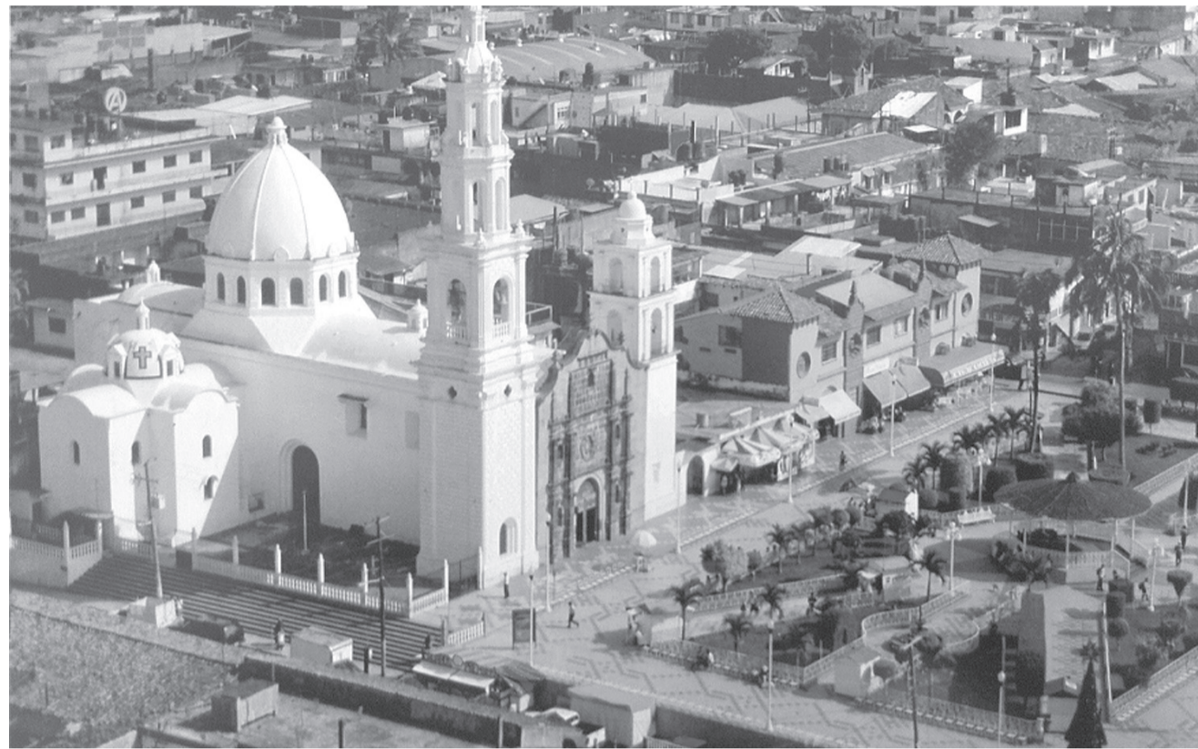
Todos los templos guardan secretos y muchos de estos jamás se conocerán.

Sobre Tomás no se supo nunca nada, simplemente desapareció. Su casa permaneció deshabitada durante mucho tiempo y un día, al