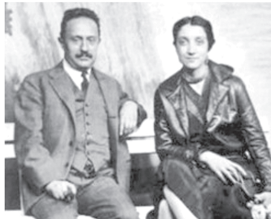
José Vasconcelos y Antonieta Rivas Mercado.