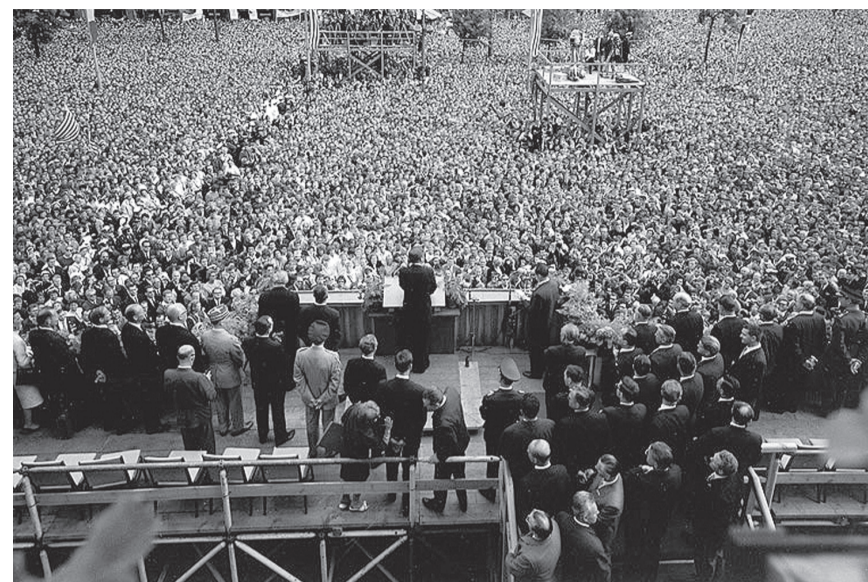
Kennedy dando su discurso contra el Muro, en Berlín, el 26 de junio de 1963, ante cerca de medio millón de personas. Ahora, con las mismas palabras estaría condenando el de Trump.

Nuestros pueblos merecen un mejor futuro.