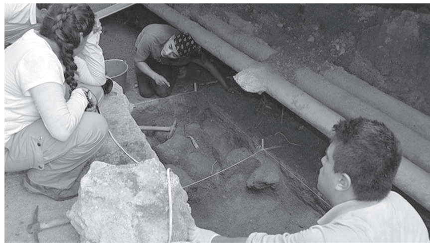
Los arqueólogos del INAH durante las excavaciones.

En El Jobo, Juan B. Diez se dedicó al tabaco, del cual tenía sembradas 200 hectáreas de muy buena calidad. La hoja de tabaco de la hacienda era reconocida mundialmente como la "Hoja del Jobo", misma que era vendida a la tabacalera de "El Buen Tono" fundada por Ernesto Pugibet, y se encontraba en la Ciudad de México, cerca de la estación de radio XEW. La del Jobo se llamaba Fábrica de Puros La Estrella. Tenía 2,000 novillos de engorda, ganado bravo, 2 mil hectáreas de