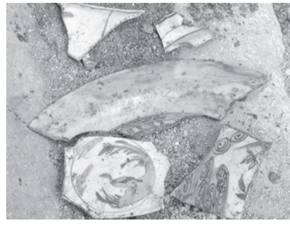
Miles de restos de porcelana china como ésta fueron descubiertos en Acapulco.