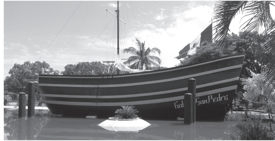
El galeón San Pedro, resguardado en la actualidad en el Parque Papagayo, en Acapulco, Guerrero, era uno de los que empleaban los misioneros filipinos para trasladarse de Asia a Acapulco y de ahí cruzaban hasta lo que hoy es Tlapacoyan.

Jobo tenía una extensión de poco más de 2,835 hectáreas. En la actualidad, sin embargo, cuando se hace referencia a la gran propiedad de 60,000 hectáreas que perteneció a Guadalupe Victoria se le llama equivocadamente El Jobo, por extensión, y se ha diluido en cientos de pequeños ranchos. Pero el lugar en el que vivió el expresidente y sólo dejó cuando su salud lo abandonó para dirigirse hacia su última morada fue el casco de la hacienda ubicada a 6 kilómetros de Tlapacoyan. El 21 de marzo de 2014, en el aniversario