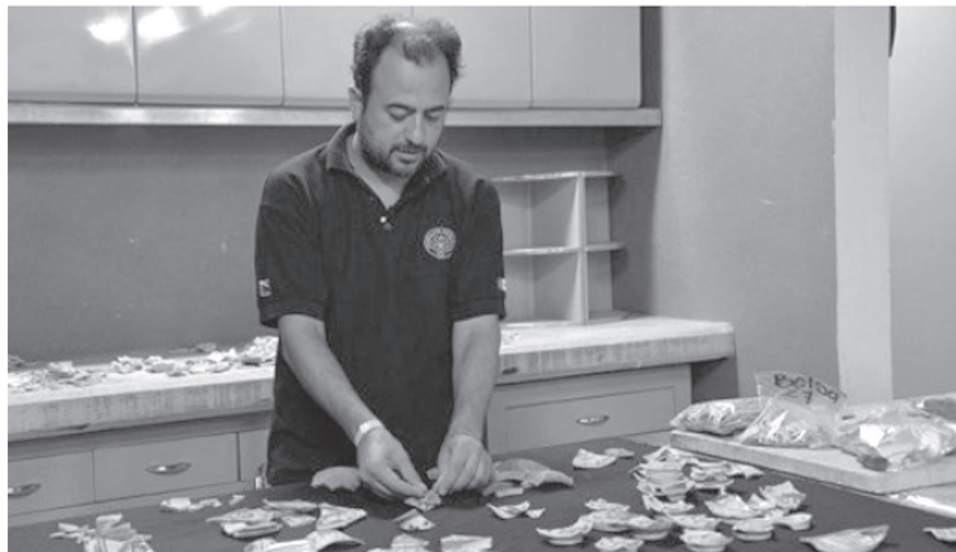
El arqueólogo examina lo que encontraron.