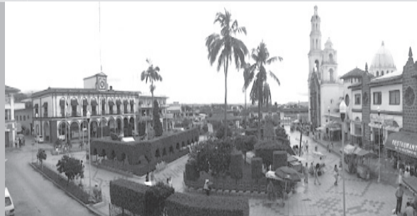
Gráfico DE MARTÍNEZ DE LA TORRE CRÓNICAS de Tlapacoyan