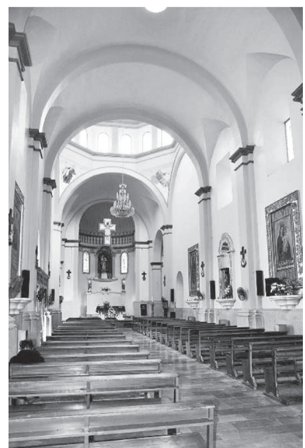
Interior de la Parroquia de la Asunción, de Tlapacoyan.