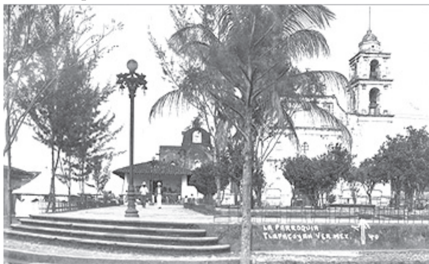
Del lado izquierdo, al fondo, se aprecia la casita que estaba junto a la Parroquia de la Asunción, en 1940.

Las imágenes y figuras colocadas en el interior de la iglesia de la Asunción están ubicadas de la siguiente manera: entrando al templo, de izquierda a derecha, la Virgen del Carmen, la