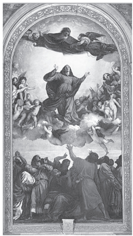
Pintura clásica de la Asunción de la Virgen, por Tiziano, localizada en Santa María Gloriosa dei Frari, Venecia, Italia, en el templo de la antigua Abadía de la Dormición de la Virgen María.