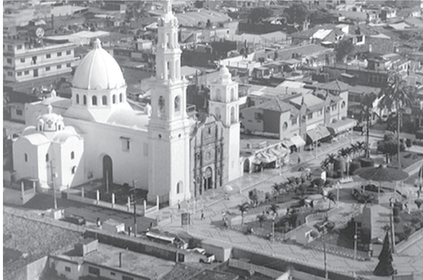
Vista aérea de la Parroquia de la Asunción.

Llama la atención que la diócesis mencionada nombre a sus regiones pastorales como foranías, y es la única que lo hace en la Arquidiócesis de Xalapa, a la cual pertenece. La otras