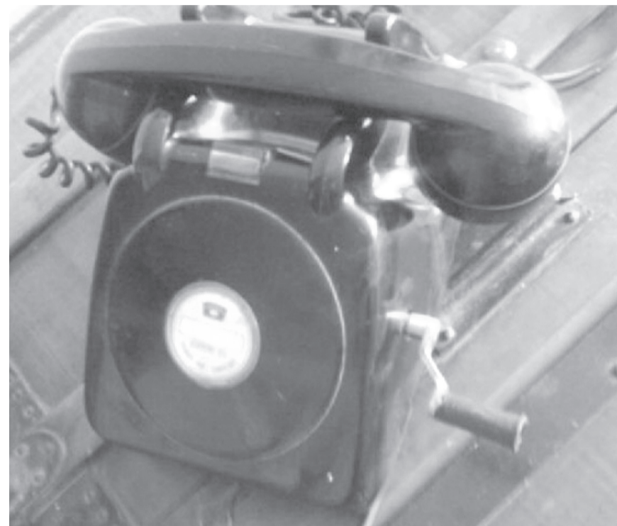
El primer teléfono que se utilizó en Tlapacoyan era de manivela.

No es necesario explicar cuál es el origen de nombres de calles como Cuauhtémoc, Juárez, Hidalgo, 5 de mayo, Zaragoza, Morelos y Mina (por citar algunos del centro histórico), porque resulta evidente, pero hubo un tiempo