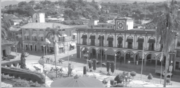
Gráfico CRÓNICAS de Tlapacoyan